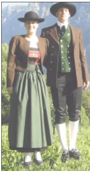
Tracht des MV Mellau.

Während andere Musikkapellen in den Sommerferien sind, gibt der Musikverein Mellau auf den verschiedensten Frühlingsfesten, Zeltfesten oder Platzkonzerten, zur Freu-