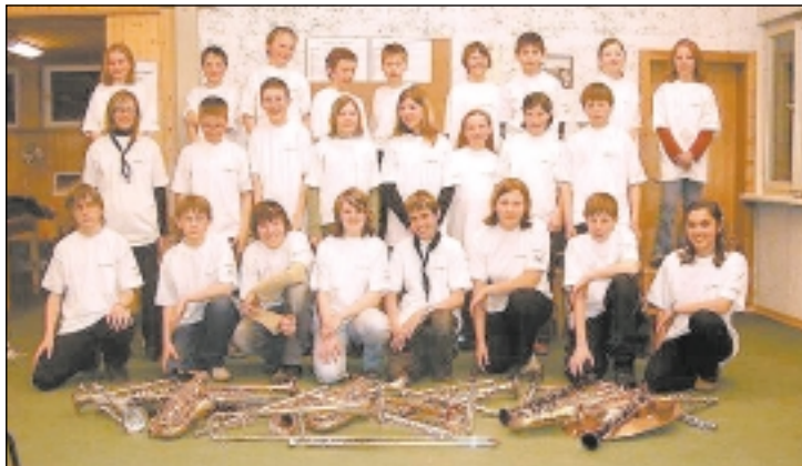
Die Jugendkapelle Mellau wurde 2002 gegründet und hat bereits 26 Mitglieder.

■ Schon drei Jahre nach ihrer Gründung hat unsere Jugendkapelle 26 Mitglieder.